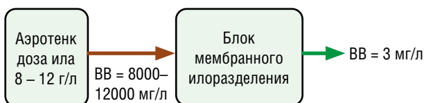
Рис. 2. Алгоритм расчета двухкомпонентного блока биологической очистки (аэротенк-биореактор + блок мембранного илоразделения)

Применение метода мембранного илоразделения и возможности ультрафильтрационных мембран (рис. 2) позволяет повысить рабочую дозу ила в аэротенках (биореакторах) до 8–12 г/л, т. е. более чем в 2 раза по сравнению с аэротенками классического исполнения блока биологической очистки, даже при применении технологии с повышенными до 5–6 г/л дозами ила (рис. 1а).